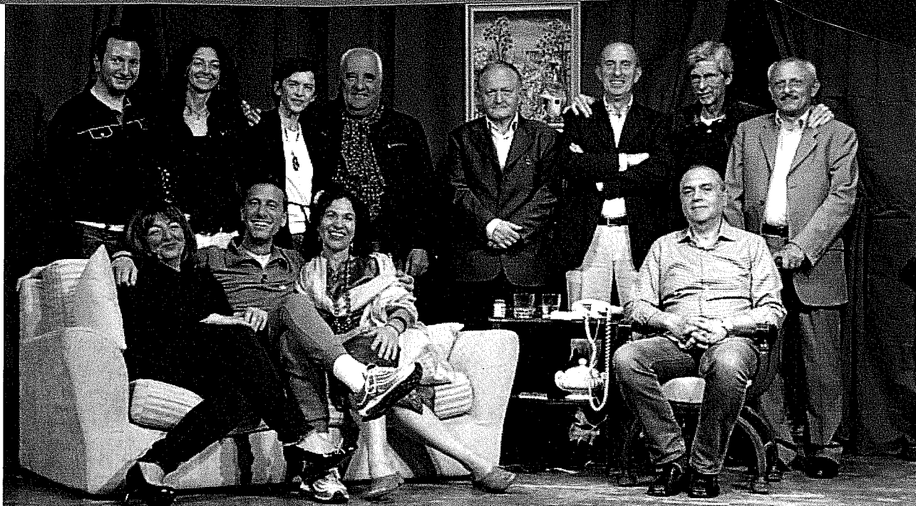
La Compagnia "Filodrammatical", promossa dai dipendenti della Banca di Forlì